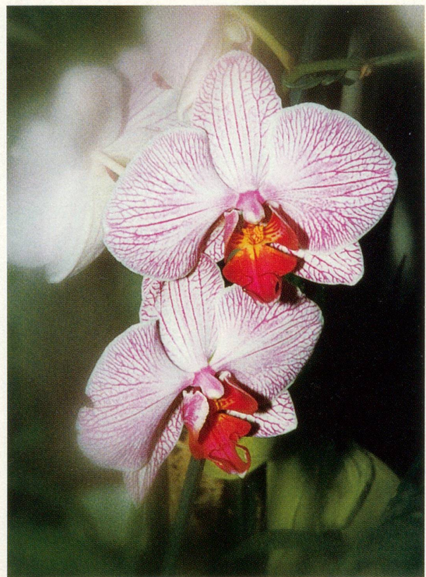
Leserfoto von Vreny Marty:

Frau E. B. aus Obernau, in Ausbildung zur Ernährungsberaterin nach Dr. M. O. Bruker, schreibt: «Es wäre abzuklären, ob das Kind mit Kuhmilch oder deren Produkten ernährt wird. Möglicherweise reagiert es empfindlich auf das «artfremde» Eiweiss der Milch. Empfehlenswert wäre dann eine Umstellung der Kost auf eine biologische Vollwertkost ohne tieri-