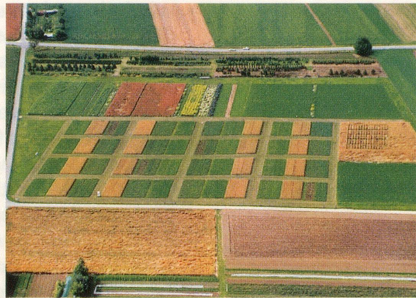
Auf den DOK-Versuchsflächen in Therwil (BL) werden verschiedene Anbauformen im Massstab 1:1 verglichen.

Die dritte grosse Aufgabe des FiBLs, die Kontrolltätigkeit und damit verbunden die Qualitätssicherung, betrifft Landwirtschafts-, Verarbeitungs- und Handelsbetriebe. Das überrascht nicht, denn die spezielle Qualität namens «Bio» bringt bekanntlich eine Fülle von Richtlinien und Vorschriften mit sich. Ihre Umsetzung im einzelnen Betrieb muss regelmässig überprüft werden. Davon hängen beispielsweise die Label-Anerkennung (z.B. Bio Suisse-Knospe der VSBLO, Demeter, Migros-Bio Production), die Umstellungsbeiträge der Kantone gemäss Ökobeitragsverordnung sowie die Direktzahlungen des Bundes an die Biobauern ab. Partner des FiBL bei dieser Arbeit sind die VSBLO ( Vereinigung schweizerischer biologischer Landbau-Organisationen ) mit rund 4000 angeschlossenen Biobauern sowie der Produzentenverein für biologisch-dynamische Landwirtschaft (DEMETER) mit rund 160 Biobauern.