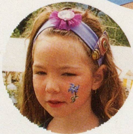
Die Malutensilien wurden gesponsert von Papeterie Markwalder, Teufen und Zolli-Bolli, St.Gallen