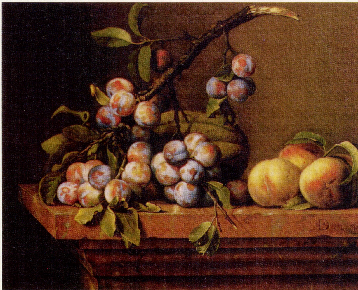
LF - GALERIE - STILLEBEN - NATURE MORTE