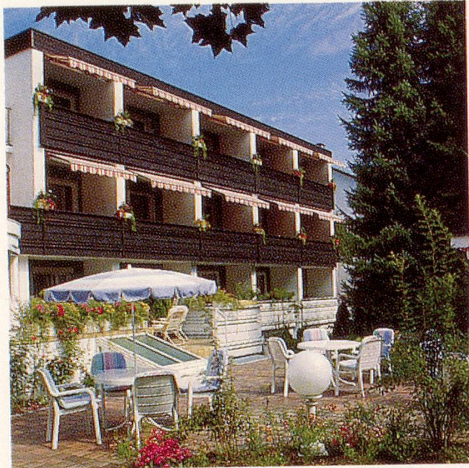
Hotel Justina **** im Kneipp-Heilbad Wörishofen im Allgäu.

In diesem Jahr bieten wir Ihnen etwas ganz Besonderes an: Kuren nach Sebastian Kneipp und Alfred Vogel – zwei großen Pionieren der Naturheilkunde. Die Kneipp-Kur findet im Juni und Juli im bekannten Kurort Bad Wörishofen statt, die A.Vogel-Kur im September im idyllischen Inzell.