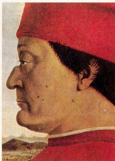
Piero della Francesca, Porträt des Federico da Montefeltro, der sich – eine Seltenheit in der bildenden Kunst – mit seinen kleinen Schönheitsfehlern abbilden ließ.