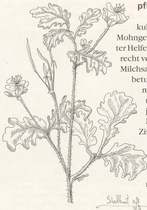
Das anspruchslose Schöllkraut ist ein bewährtes natürliches Mittel gegen Warzen.

Andere Überlieferungen raten zum Einreiben mit Rizinus- oder Johanniskrautöl, mit Lauch, dem Saft einer durchgeschnittenen Zwiebel oder Knoblauchzehe oder dem Saft von unreifen Walnußschalen.