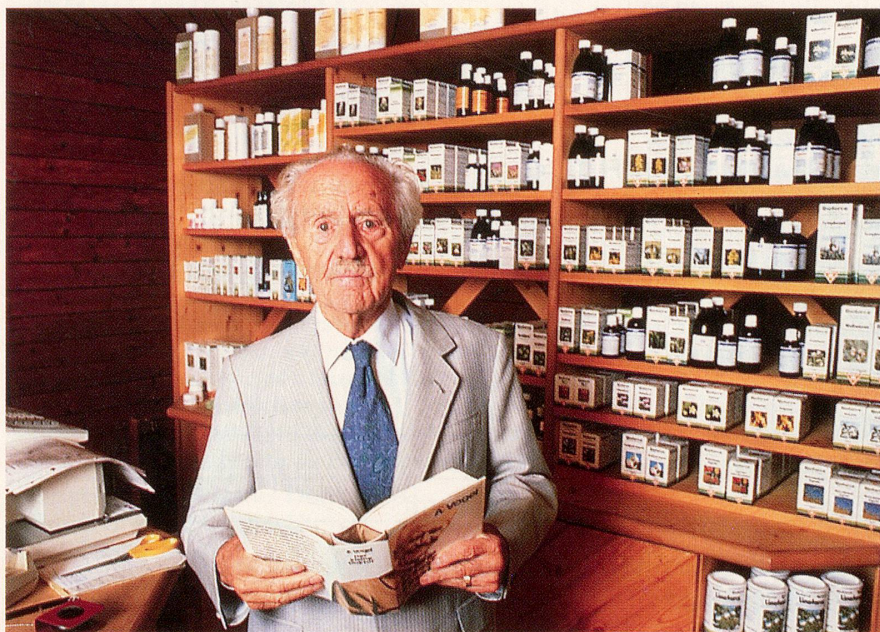
Alfred Vogel in der Drogerie in seinem Gesundheitszentrum in Teufen, Appenzell Außerrhoden.

Der Schweizer Medientag mit internationaler Beteiligung schloss mit einer Würdigung des Lebenswerks von Dr. h.c. Alfred Vogel, der in den 30er Jahren in Teufen AR mit einer Naturheilpraxis begann und heute in aller Welt als Heilpflanzenforscher, Ernährungstherapeut, Publizist und Gründer der auf allen Kontinenten tätigen Naturheilmittelfirma Bioforce AG bekannt geworden ist. ●