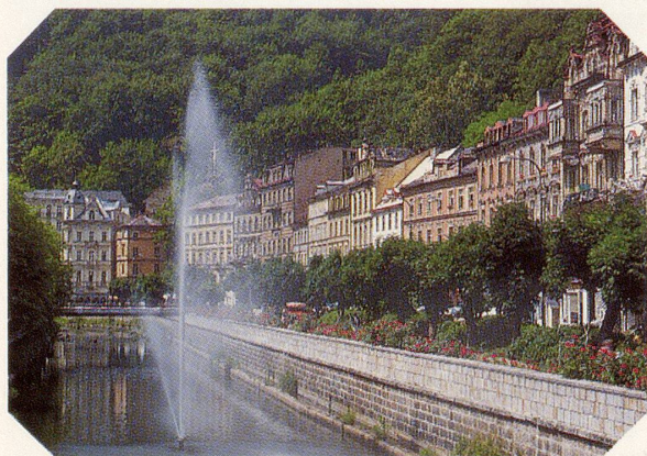
Seit 600 Jahren Badehochburg: Karlsbad