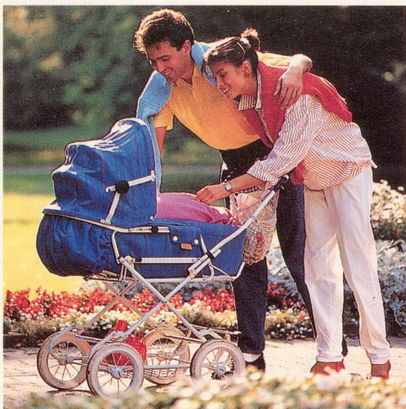
Glückliche Eltern – glückliches Kind.

zur Mutter gebracht. Es öffnet entspannt seine geballten Fäustchen, lächelt und signalisiert damit Frieden. Und die Familie nimmt dieses Wunder freudig und dankbar auf. ●