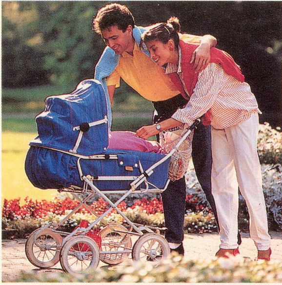
Glückliche Eltern – glückliches Kind.

zur Mutter gebracht. Es öffnet entspannt seine geballten Fäustchen, lächelt und signalisiert damit Frieden. Und die Familie nimmt dieses Wunder freudig und dankbar auf. ●