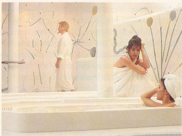
Entspannen, sich erholen, sich natürlich pflegen, kurz: gut zu sich selber sein. Im neuen Bad Ragazer Gesundheitsklub.

ein Zusammenspiel der entspannenden Elemente Klang, Licht, Wasser und Duft darstellen. Durch Dampf und eine spezielle Erwärmung stärkt das Thermarium die körpereigenen Abwehrkräfte. Im Aroma-Duftbad spürt der Gast die wohltuende Wirkung von Wärme und Heildüften eigener Wahl. Schliesslich bietet das Aurarium als Doppel-Whirlpool mit Aromen, Licht- und Farbenspiel eine kreative Form des Badens.