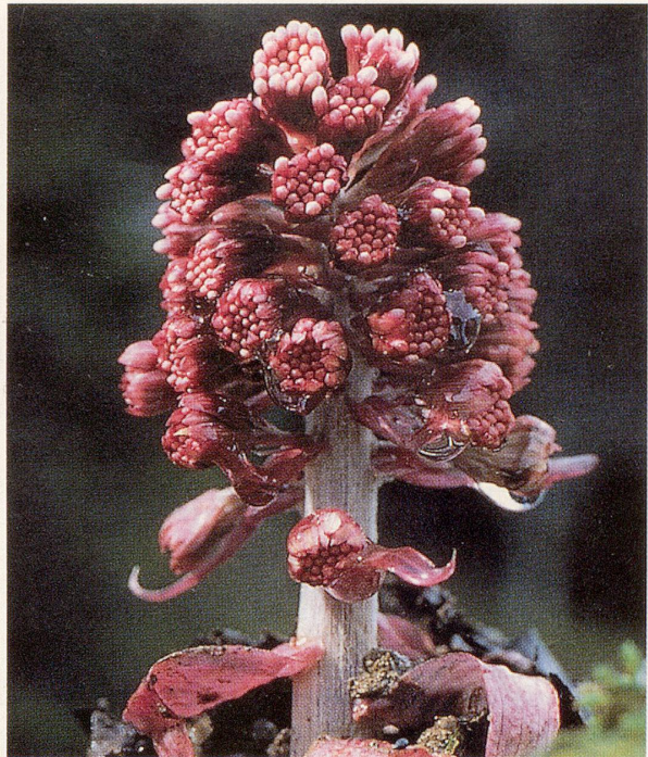
Die Pestwurz ( Petasites hybridus ) ist bekannt als schleimlösende Heilpflanze. Dass damit noch ganz andere Leiden behandelt werden können, berichtete uns eine Leserin.