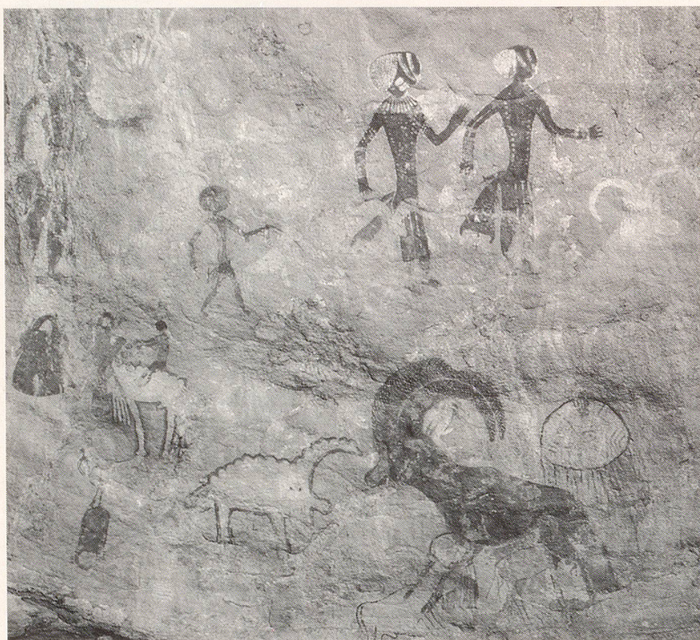
Schon immer haben Menschen gemalt – Höhlenmalerei in den Bergen Algeriens.

Die ältesten bekannten und vielbewunderten Werke sind die Höhlenmalereien von Lascaux und Altamira. Doch hat der künstlerische Ausdruck der Menschen damals sicher nicht mit solch hochentwickelten Werken begonnen. Die Entwicklungsstufen, die vorausgingen, kennen wir nicht. Wir können uns vorstellen, dass ein Mensch einmal seine Hand oder seinen Finger ins Wasser oder in den Schlamm tauchte und auf eine glatte Fläche eine Spur strich. Bei kleinen Kindern können wir dieses ursprüngliche Tun immer wieder beobachten.