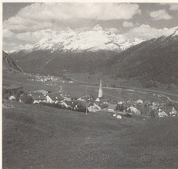
Im Touristenort Zuoz werden auch Entschlackungskuren nach A. Vogel durchgeführt.

Nach ihrem beachtlichen Erfolg im letzten Jahr führt die Praxisgemeinschaft für ganzheitliche Lebenshilfe von Ruth Conte und Oskar Korner im kommenden Herbst in Zuoz im Unterengadin erneut sogenannte integrale Ge-