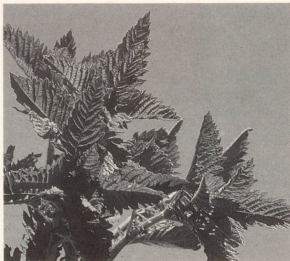
Heilpflanze Brennessel: Hervorragend zur Aktivierung des Kalkstoffwechsels, wenn der älter werdende Körper auf eine erhöhte Kalziumzufuhr angewiesen ist.

Weil ältere Menschen Kalzium schwerer aufnehmen, sind sie auf eine erhöhte Kalkzufuhr angewiesen. Damit der Körper diese Mineralstoffe aber wirklich assimilieren kann, ist pflanzlich gebundener Kalk notwendig, wie er in der kalkreichen Brennessel vorkommt und in A. Vogels Urticalcin in homöopathischer Form vorliegt.