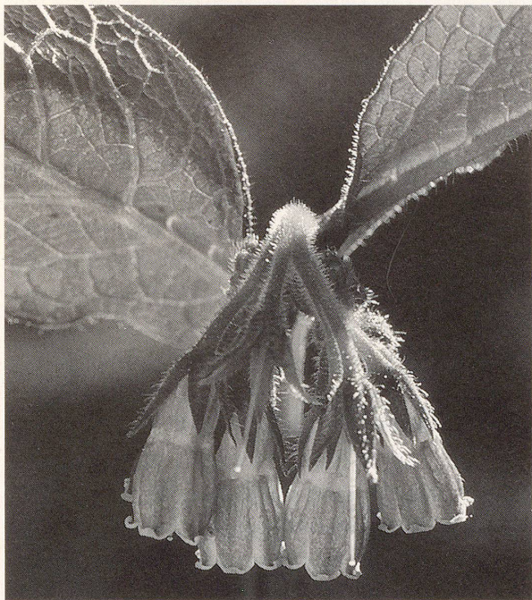
Wallwurz unterstützt die Heilung von Gelenkerkrankungen.

«Ich möchte Ihnen mitteilen», berichtet uns Frau H.E., «dass meine Schwester dank einer in den GN veröffentlichten Lesernachricht ihren schlimmen Fuss (einen Sudeck) im Sprunggelenk total geheilt hat. Einige Monate täglich Umschläge mit Wallwurzinktur, vermischt mit Honig, brachten den Erfolg. Und dies nach wochenlangen Therapien bei Orthopäden.»