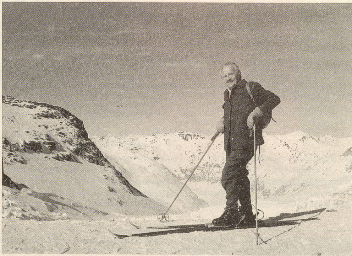
Skiwanderungen in der winterlichen Bergwelt: Herrliches Naturerlebnis, aber nicht ohne Gefahren. Auch für die Sonne gilt Alfred Vogels naturheilkundliche Erkenntnis: «Kleine Reize regen an, grosse Reize wirken zerstörerisch.»

Die Baumgrenze hatten wir in der Regel längst hinter uns gelassen, wenn es zu dämmern begann und uns schliesslich die ersten Sonnenstrahlen begrüßten. So ging es in stundenlanger Skiwanderung, unterbrochen natürlich durch Erholungspausen, hoch bis zum Gipfel