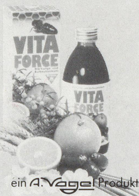
ein A. Vogel Produkt

In der BR Deutschland unter dem Namen «A. Vogels Vitalextrakt» im Handel