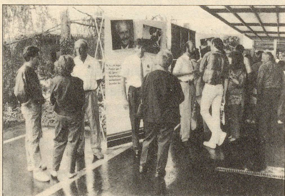
Kompetente Fachberatung wird bei der Bioforce gross geschrieben.

Das «Fest der Natürlichkeit» in Roggwil ist vorbei. Geblieben aber ist ein bleibender Eindruck. Die über 9000 Besucherinnen und Besucher haben, so glaube ich, ein untrügliches Zeichen gesetzt. Ein Zeichen nämlich zugunsten einer natürlichen, die positiven Kräfte unterstützenden Lebens- und Heilweise – ein Zeichen aber auch gegen die überbordenden Degenerationser-