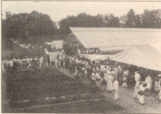
Das neue grosse Treibhaus wurde im letzten Frühjahr eröffnet.

«weissen Tod». Sein natürlicher Instinkt und seine leidenschaftliche Liebe für die Natur waren in der Folge stets dazu ange- tan, ihm und seinem grossen Lebenswerk den klaren Weg zu weisen: Nahrungs- und Heilmittel möglichst in der Form einzunehmen, wie sie von der Schöpfung zu unserem Wohl erschaffen wurden.