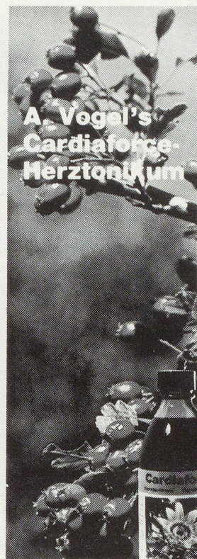
In der BRD auch in Reformhäusern erhältlich.

8426 Lufingen, Ziegeleistr. 15, Tel. 01 8134788