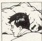
Falsche Kopflage: mit gewöhnlichem Kissen

Wenn Sie auf dem Bauch schlafen wollen, können Sie es jetzt, ohne den Hals zu verdrehen, und dabei erst noch freier atmen . Schlafen Sie auf dem Rücken, so haben Sie beste Gewähr, nicht mehr zu schnarchen . Und zugleich können Sie die Bildung eines Doppelkinns verhindern . Schlafen Sie seitlich, so ruhen Kopf und Nacken in der anatomisch richtigen Lage .