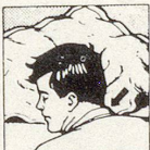
Falsche Kopflage: mit gewöhnlichem Kissen

Wenn Sie auf dem Bauch schlafen wollen, können Sie es jetzt, ohne den Hals zu verdrehen, und dabei erst noch freier atmen . Schlafen Sie auf dem Rücken, so haben Sie beste Gewähr, nicht mehr zu schnarchen . Und zugleich können Sie die Bildung eines Doppelkinns verhindern . Schlafen Sie seitlich, so ruhen Kopf und Nacken in der anatomisch richtigen Lage .