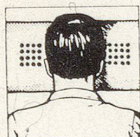
Richtige Kopflage: mit HOLLYBED