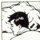
Falsche Kopflage: mit gewöhnlichem Kissen

Wenn Sie auf dem Bauch schlafen wollen, können Sie es jetzt, ohne den Hals zu verdrehen, und dabei erst noch freier atmen . Schlafen Sie auf dem Rücken, so haben Sie beste Gewähr, nicht mehr zu schnarchen . Und zugleich können Sie die Bildung eines Doppelkinns verhindern . Schlafen Sie seitlich, so ruhen Kopf und Nacken in der anatomisch richtigen Lage .