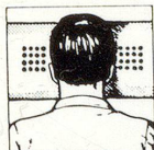
Richtige Kopflage: mit HOLLYBED