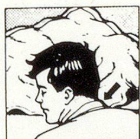
Falsche Kopflage: mit gewöhnlichem Kissen

Wenn Sie auf dem Bauch schlafen wollen, können Sie es jetzt, ohne den Hals zu verdrehen, und dabei erst noch freier atmen . Schlafen Sie auf dem Rücken, so haben Sie beste Gewähr, nicht mehr zu schnarchen . Und zugleich können Sie die Bildung eines Doppelkinns verhindern . Schlafen Sie seitlich, so ruhen Kopf und Nacken in der anatomisch richtigen Lage .