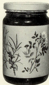
450 g Glas nur 4.50