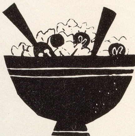
Thomi + Franck AG Basel