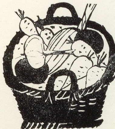
Thomi + Franck AG Basel