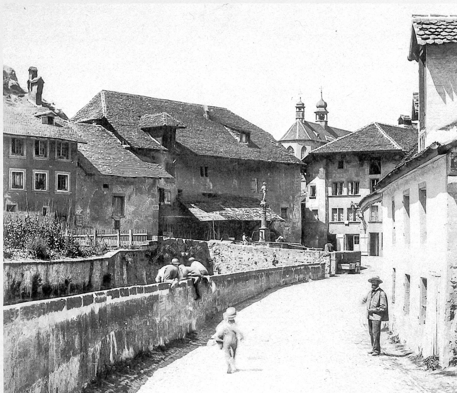
Vue de la porte du Gottéron, la maison Mooses et sa grange-écurie dans les années 1880-1890

«Celui qui visite les habitations du quartier de l'Auge est bien étonné parfois d'y découvrir des pièces d'une dimension qu'atteignent à peine celles des vastes appartements modernes. Les ornements en stuc des plafonds, noircis par le temps, les boiseries richement sculptées dissimulées sous le crépi, la belle ornementation gothique qui se retrouve à la façade extérieure des maisons, témoignage des gloires passées, s'harmonisant peu, hélas! avec les escaliers vermoulus et les débouchés des nombreux logements pratiqués dans les vastes vestibules de la maison d'autrefois. Et ce qui s'ac-