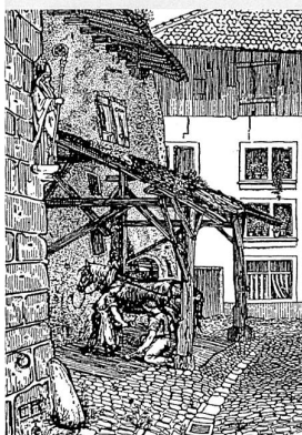
Le maréchal-ferrant Mooses au travail, par Eduard von Rodt, années 1880 (AFMH)

cuisine et on y travaille. Un tel état de choses ne peut présenter que des vices graves, tant au point de vue social qu'à celui de la moralité et de l'hygiène» 26 . Publiées en 1908, ces lignes concluent l'enquête de Hans Schorer sur les logements locatifs dans la ville de Fribourg. Pendant qu'une nouvelle élite prend possession de ses nouveaux quartiers dans la cité-jardin de Gambach et dans les vastes appartements qu'offrent les immeubles de rapport de Pérolles ou du Pré d'Alt, la Basse-Ville croulait dans une effrayante promiscuité où l'on meurt pour un rien de tuberculose, de pneumonie et de gastro-entérite. Depuis 1870, la population urbaine avait augmenté de 45% pour seulement 22% de nouveaux appartements. Fribourg détenait alors un triste record national avec 2,67 habitants par pièce de logement et 93% des appartements ne disposaient que d'une ou de deux chambres. Avec la construction du Grand-Pont suspendu (1834) et de la gare (1866), la modernité était passée par-dessus la Basse-Ville où s'entassaient toutes les illusions perdues. Laissées exsangues par la déconfiture financière du chemin de fer et volontiers adeptes des nouvelles théories du compartimentage urbain, les autorités s'étaient résignées à laisser la Basse-Ville aux ouvriers. L'Auge à la Belle Epoque est une ville coupée du monde, un ghetto en quarantaine