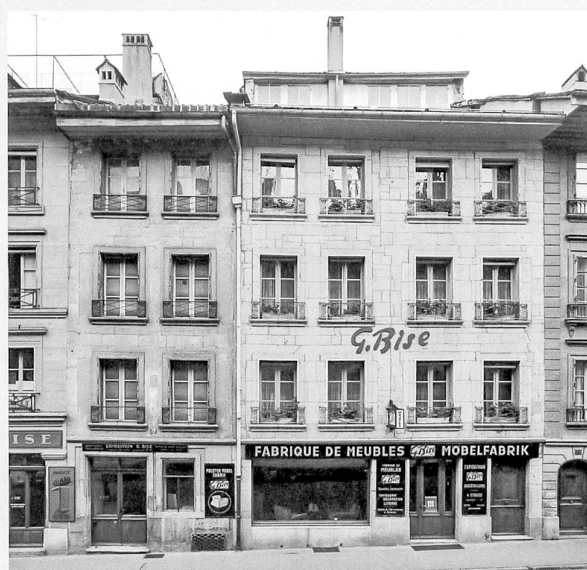
Grand-Rue 12A-12B, photographiés par Jacques Thévoz au début des années 1960 pour le volume non publié de Marcel Strub

Ces pièces rares sont liées à la fonction du bâtiment, qui servait de pharmacie depuis le début du XIX e siècle. Il est probable qu'elles appartenaient au pharmacien Jean Jacques Muller, qui acheta en mars 1782 la maison Grand-Rue 15 et y ouvrit en septembre une pharmacie à l'enseigne du Cerf 10 . Vingt ans plus tard, le 7 septembre 1802, il échangea