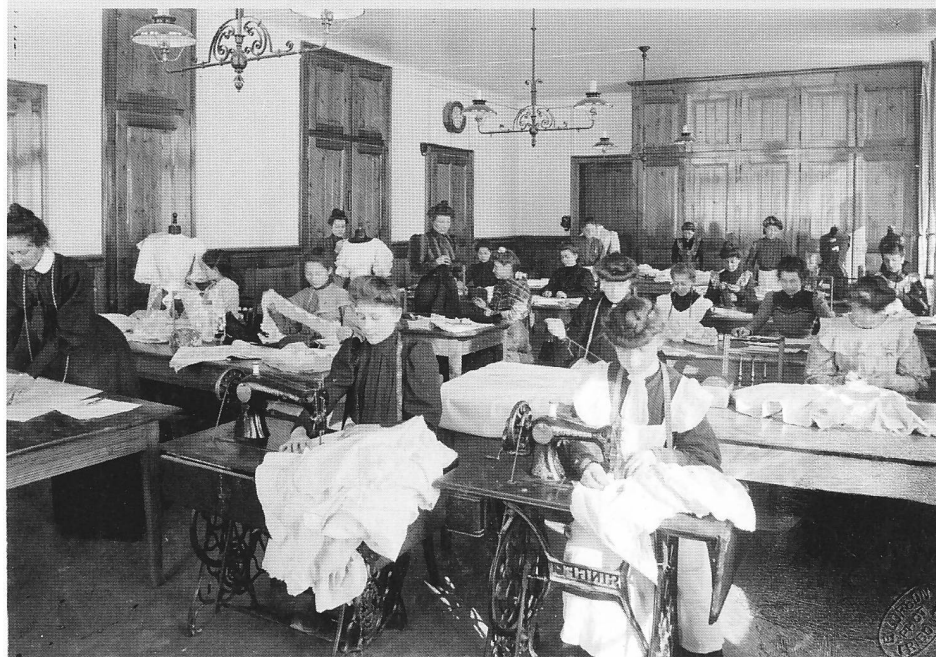
Atelier des apprenties lingères, confectionnant des jupons de dessous et des chemises de nuit, (BCUF, Fonds Ernest Lorson)

A sa fondation en 1849, l'Ecole secondaire des filles ne fut pas placée, comme le suggérait Alexandre Daguét «sous la direction laïque et peu dispendieuse d'une ou de deux dames du pays», mais confiée au lucernois Josef Ariger. Les premiers cours furent dispensés uniquement par des hommes, à l'exception des ouvrages manuels et de l'économie ménagère assurés par une femme mariée, Catherine Dietrich, à qui l'on demandait cependant de «chaperonner» ses collègues masculins durant leur enseignement! Les cours d'économie ménagère, déjà prévus par la Loi du 23 septembre 1848 sur l'instruction, ne furent introduits qu'en 1890 et déclarés obligatoires dans le canton 17 . Fribourg ne connaissait cependant pas de formation professionnelle féminine comme Zurich, Bâle ou Berne à partir de 1888. Sous l'impulsion d'un directeur visionnaire,