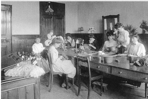
Atelier des apprenties modistes, confectionnant des chapeaux de dentelle et des barettes

23 Deux abonnements furent souscrits (AVF, PCC, 27 juin 1905).