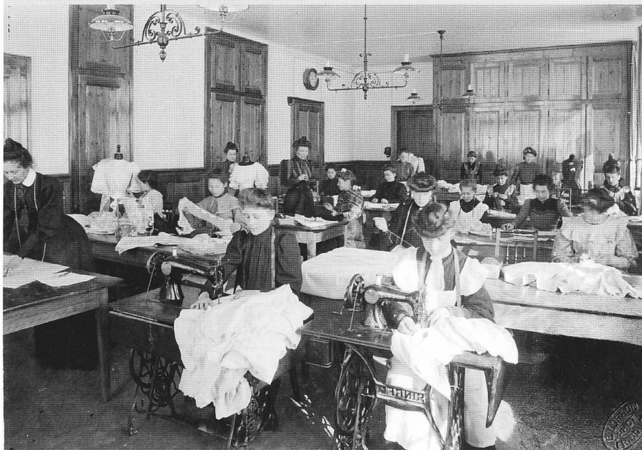
Atelier des apprenties lingères, confectionnant des jupons de dessous et des chemises de nuit