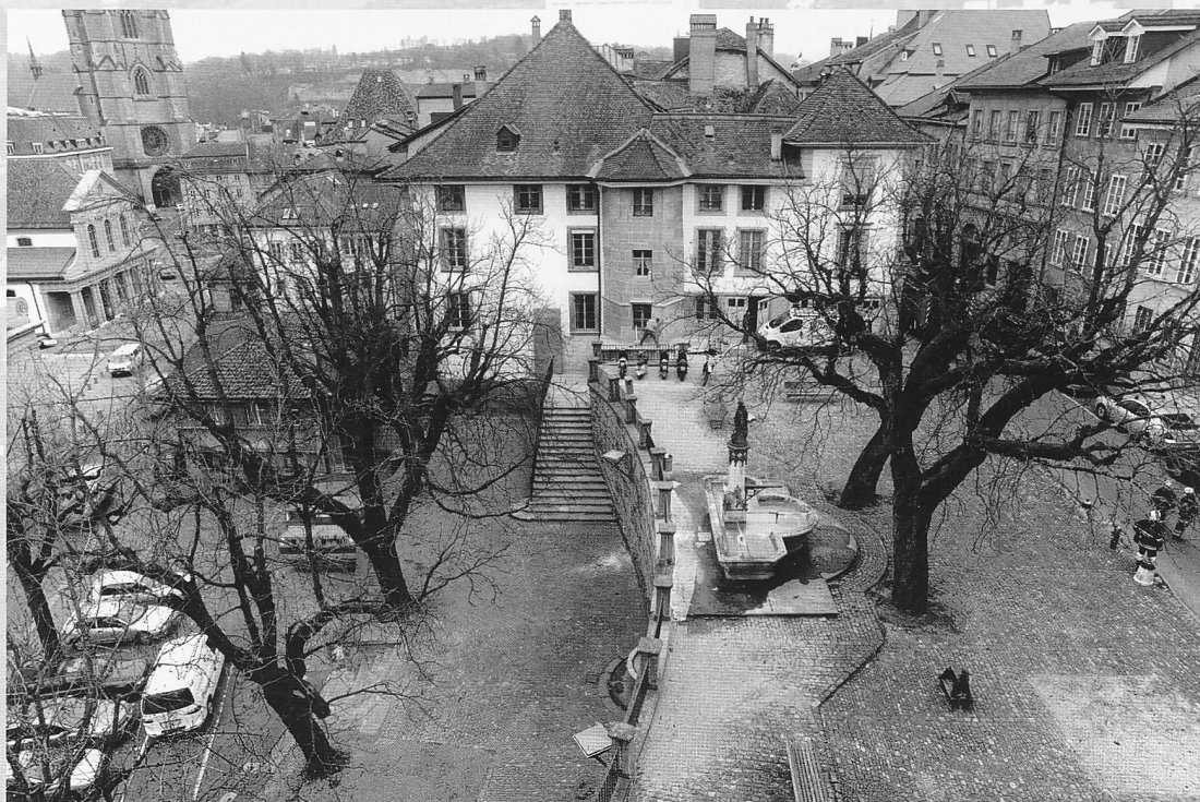
Espace public créé en 1763-1764 et réaménagé dans son état actuel en 1825