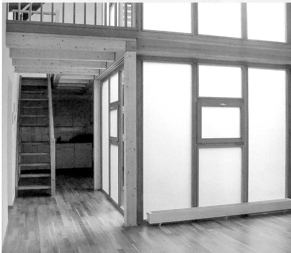
Rue de la Neuveville 21, l'un des appartements actuels éclairé par le nouveau puits de lumière

comme le laisserait supposer la façade sur rue avec ses articulations néoclassiques. Elle devait être bien aménagée, dotée notamment d'«un splendide poêle de faïence vendu à un antiquaire pour le prix de 350 francs». Cette vente malheureuse précéda la démolition presque complète des intérieurs en 1922, l'immeuble étant alors jugé trop délabré pour être restauré. Avec les maisons de la rue d'Or 3 et de la rue des Forgerons 8, ce bâtiment avait en effet été acquis par la Société pour l'amélioration du logement populaire fondée le 23 juillet 1922, dont le but était «de donner à l'ouvrier un logement sain, propre, confortable autant que possible, qu'il ne soit pas tenté de fuir pour trouver à l'auberge voisine un local agréable» 18 . Cette entreprise philanthropique, soutenue par la ville, participait ainsi à la grande croisade des autorités contre l'immoralité. En rachetant des immeubles insalubres qu'elle rénovait de manière à offrir des logements convenables aux ouvriers, cette institution a conforté la vocation ouvrière de la Basse-Ville tout en sauvant de la spéculation et même d'une démolition pure et simple une vingtaine