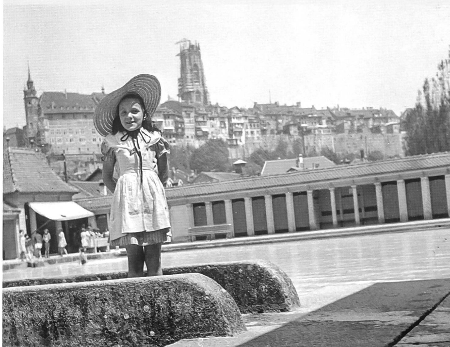
Pose à l'entrée de la passerelle de la Motta, en 1939 (Médiacentre)

soleuroise. A Fribourg comme à Burgdorf, l'ingénieur s'est effacé derrière les architectes. Mais à Adelboden, à Wengen et surtout à Heiden où il obtint l'ensemble du mandat,