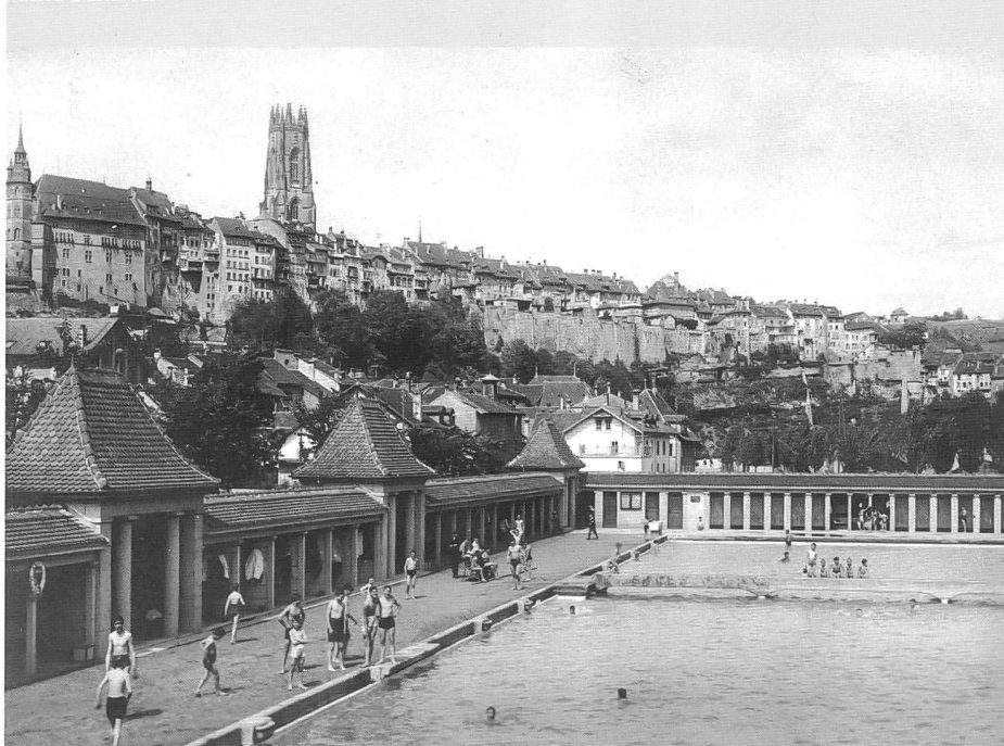
Jour d'été à la Motta avant 1947, avec la passerelle séparant grand et petit bassin (carte postale, ASBC)

Si la volonté d'intégration au site justifie le parti Heimatstil des architectes, la réalisation et les installations témoignent de l'esprit moderne qui soufflait alors sur Fribourg où les entrepreneurs emmenés par quelques ingénieurs