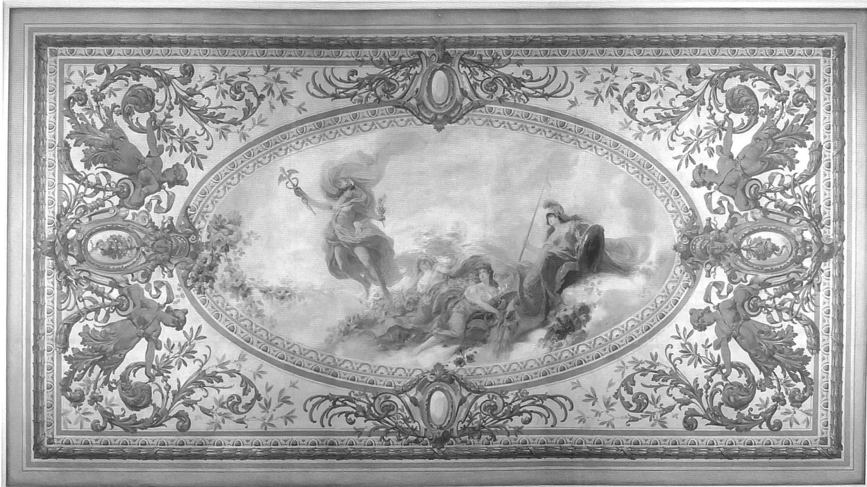
Plafond peint du hall des guichets, avec dans le médaillon central, l'allégorie de l'Abondance entre Apollon et Diane, œuvre du peintre Otto Haberer-Sinner

un tournant. Vouée désormais au service et aux installations du téléphone et du télex, l'ancien siège principal perdit sa vocation de bâtiment public et le hall des guichets fut fermé. Après