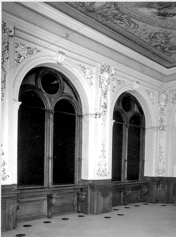
Le hall des guichets, état actuel

Neirivue pour le rez-de-chaussée, mis à part les arcades d'entrée sur rue et sur cour et la corniche du rez-de-chaussée en granit du Gothard, pierre de Savonnière pour les étages et grès dur de Marsens pour les escaliers. Avec leur niveau de soubassement en bossages continus en tables et leur ordre colossal ionique liant les étages, les façades ont conservé un caractère monumental rare à Fribourg, affirmé par l'alternance des frontons du 1 er étage et les croisées supérieures à deux meneaux inscrites dans la largeur des travées. Au cou-