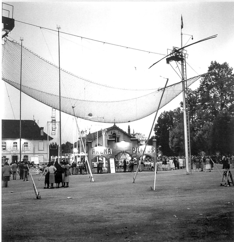
Jour de cirque sur les Grand-Places, dans les années 1950

22 ASBC, Procès-verbal de la réunion convoquée par la Société de développement de Fribourg, du 25 avril 1952. Voir également: Yoki, Que va-t-on construire aux Grands-Places, in: La Liberté, 26 mars 1952 et A. T., Vers un plan général d'urbanisme. Verrons-nous un jour un jardin public aux Grands-Places, in: La Liberté, 26 avril 1952.