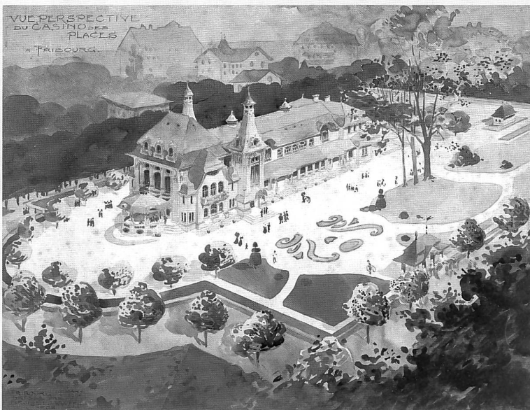
Le casino des Grand-Places, vu par le bureau Broillet & Wulfleff, 12 mars 1906 (AEF)

Construite en 1894-1895 sur les plans de l'architecte Fraisse,