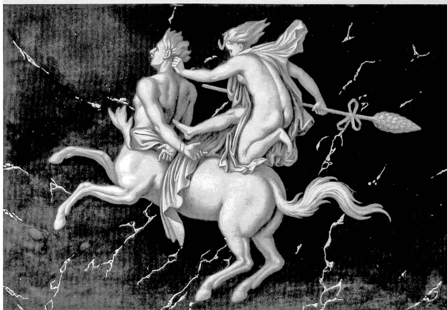
Centaure chevauché par une ménade, dessus-de-porte, grand salon du 1 er étage, années 1780

Naples qui en fit cadeau à divers privilégiés. Un centaure et une «centauresse» furent à nouveau publiés en 1779 dans la cinquième livraison du premier volume du «Voyage pittoresque» de l'abbé de Saint-Non 20 , gravés d'après un dessin de l'architecte Pierre-Adrien Pâris. Le motif du centaure chevauché par une ménade fut si prisé qu'il figurait au catalogue de la manufacture de Joseph Beunat à Sarrebourg en 1819 comme ornement d'architecture proposé en «carton-pierre» 21 . La série complète de Fribourg copie manifestement