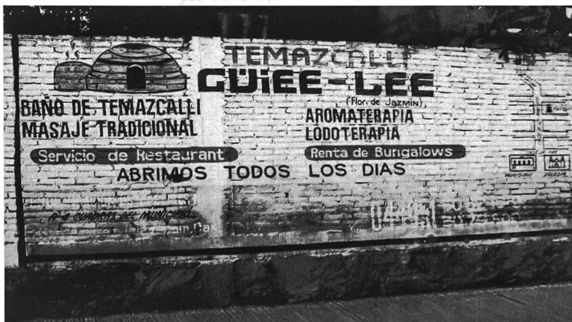
Figura 4: Letrero indicador de un baño temazcal en Huayapam, Oaxaca (Fotografía MSK)

El rótulo llama la atención por varios aspectos, entre los cuales destaca el uso de las diferentes lenguas español, inglés, náhuatl y zapoteco, la selección de los colores nacionales mexicanos, blanco, verde y rojo, la combinación entre letras, pictograma y, al lado extremo derecho, el croquis de un mapa que hace alusión al tipo de texto colonial de los códices. La visibilidad del náhuatl se muestra en el uso de la palabra para denominar el baño de vapor de tradición azteca, temazcalli , ‘casa de baño’ en vez de usar el término adaptado al español que forma parte del léxico del español mexicano, temazcal . El zapoteco se presenta en la palabra compuesta güiee-lee , cuya traducción se encuentra abajo de ella entre paréntesis, flor de Jazmín . Se encuentran otras palabras en español, tales como masaje tradicional , aromaterapia , lodoterapia , los sintagmas abrimos todos los días , a 4 cuadras del municipio , portadores de información adicional. Por fin, se observa el uso del inglés en las palabras restaurant (en vez del término en español, restaurante ) y bungalow . Juntas, las características componen un texto complejo y polífono en el que están presentes tanto el emisor como el destinatario del mensaje: el uso del náhuatl y del zapoteco se puede adscribir a la voz del productor del texto, en el uso del español y del inglés se muestra el destinatario, es decir, el grupo de personas de habla