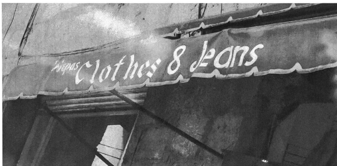
Figura 5: Letrero de tienda de ropa para dama, Oaxaca Centro