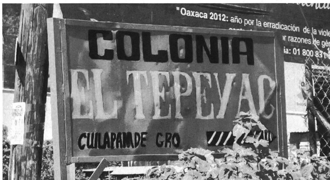
Figura 2: Letrero colonia Tepeyac, Oaxaca

El siguiente letrero también es portador de un topónimo azteca e indica el lugar de una colonia reciente en la periferia de la ciudad con nombre El Tepeyac .