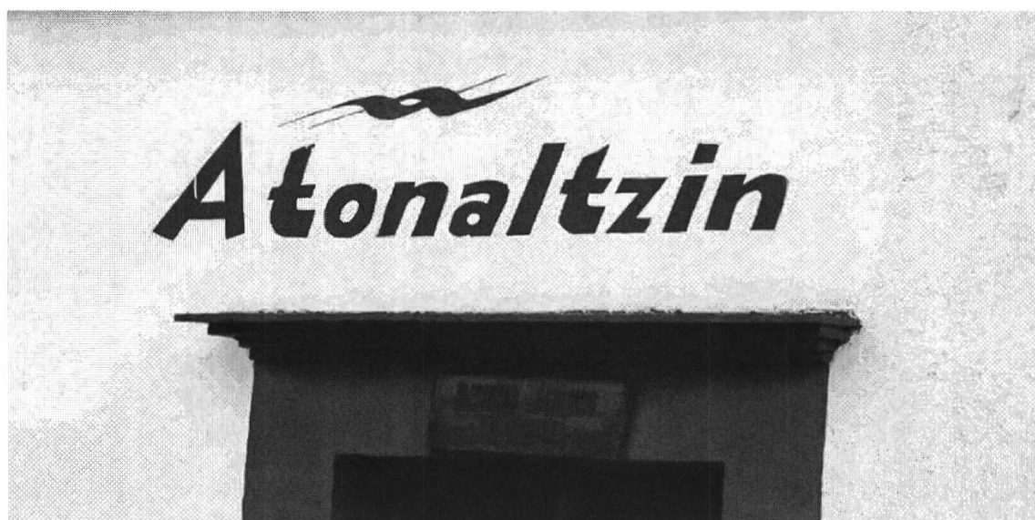
Figura 8: Nombre de empresa de transporte público, Oaxaca Centro

La serie de ejemplos de letreros en lengua náhuatl que se analizan a continuación forman parte del paisaje lingüístico del centro de la ciudad y del tipo de letreros de comercio. Se intenta mostrar que la deslimitación de lo local y regional responde a un contramovimiento del uso de la lengua indígena como referencia a lo tradicional mexicano. Tal como en los ejemplos de delimitación espacial, destaca que esta referencia se realice por el uso del náhuatl en letreros de tiendas.