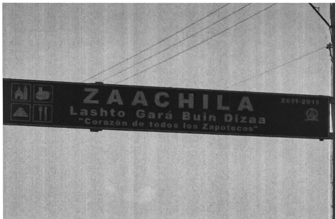
Figura 3: Señal indicadora de la entrada a la población de Zaachila, Oaxaca

Mientras que en estos casos se trata de establecer “espacios-contenedores”, es decir, subespacios simbólicamente cerrados, el letrero siguiente marca un espacio de transición geográfica y simbólica. Es interesante que para esto se recurra a la lengua local, el zapoteco.