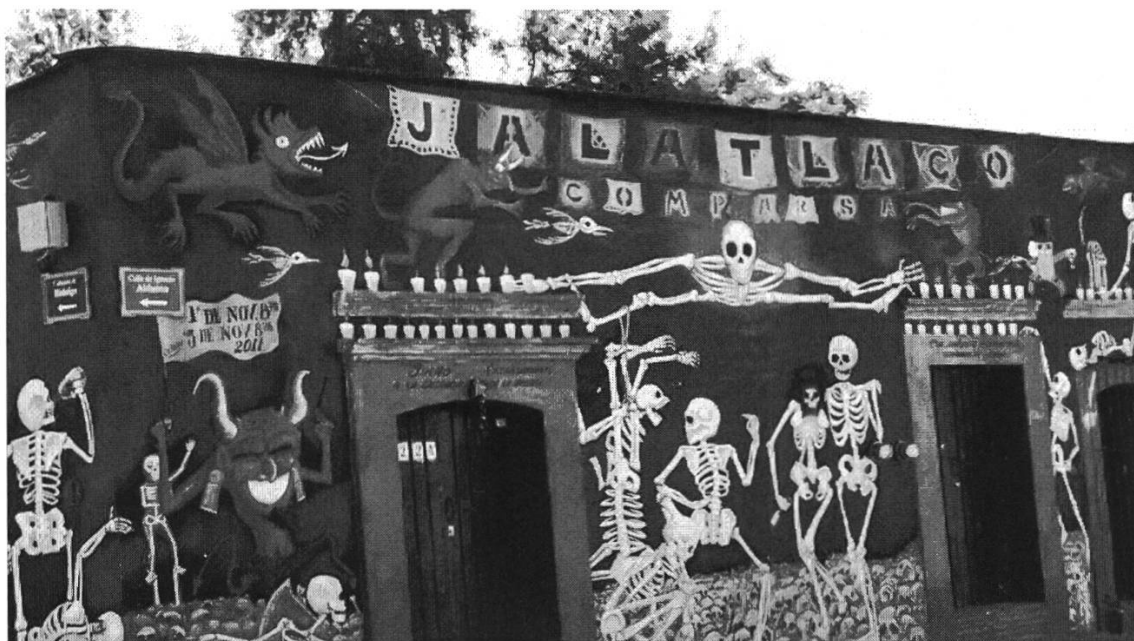
Figura 1: Casa pintada en Jalatlaco, Oaxaca

Como primer ejemplo de análisis (figura 1) se presenta la fotografía de una casa pintada y rotulada que se encuentra en el antiguo poblado (colonial) de Jalatlaco, hoy en día barrio de la zona centro de la ciudad de Oaxaca.