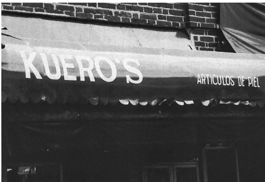
Figura 6: Letrero de artículos de piel, Oaxaca Centro