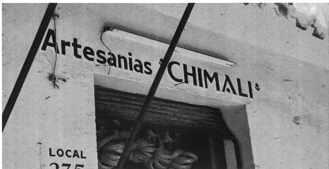
Figura 9: Tienda de artesanías, Oaxaca Centro

La siguiente fotografía (figura 9) muestra el letrero de una tienda de artesanías regionales.