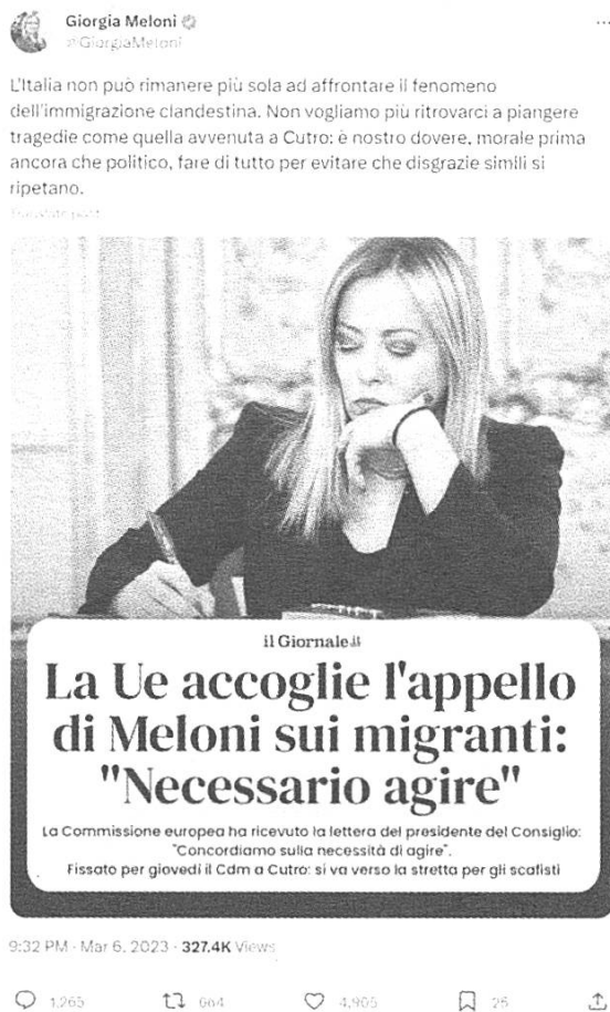
Fig. 7: tweet di @GiorgiaMeloni 28/04/2023

In fig. 7, i piani enunciativi introdotti nel testo riassumono più discorsi, che però "assommano idealmente a un unico discorso unitario, per funzione, scopo o effetti" (Calaresu 2004: 54) se si considera anche il messaggio principale del tweet. I due discorsi non sono però identici. Il discorso riportato, "Necessario agire", potrebbe infatti essere la citazione di un parere autonomo espresso dalla Commissione europea sulla lettera di Meloni. Il titolo dialogico del quotidiano è, al pari del discorso riportato presente in fig. 5, l'elemento saliente del testo modalmente complesso, che crea un legame tra l'opinione del personaggio politico (prima parte del tweet), la lettera inviata e riprodotta all'interno del giornale, e l'immagine (Meloni è raffigurata mentre sta presumibilmente scrivendo la lettera di cui si parla).