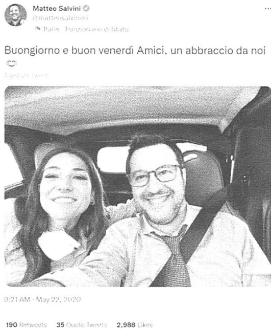
Fig. 2: tweet di @matteosalvinimi del 22/05/2020

In questo tipo di composizione modalmente complessa, l'ibridazione tra privato e pubblico viene utilizzata "come strategia comunicativa utile per avvicinare il leader agli elettori" (Mazzoleni & Bracciale 2019: 42), e come strumento con cui avviene l'autopromozione dell'attività politica del singolo. La multimodalità ha perciò il compito di suscitare vicinanza con gli utenti evidenziando il "dominio personale e intimo del soggetto politico, delle sue relazioni amicali e degli spazi personali" (Rega & Bracciale 2018: 69). Il senso di autenticità (seppur illusoria) dello scambio tra emittente e ricevente è enfatizzato, in fig. 2, dall'informalità degli elementi linguistici presenti nel corpo principale del testo ("Amici", "un abbraccio") e dalle componenti non verbali, quali l'emoji e il selfie.