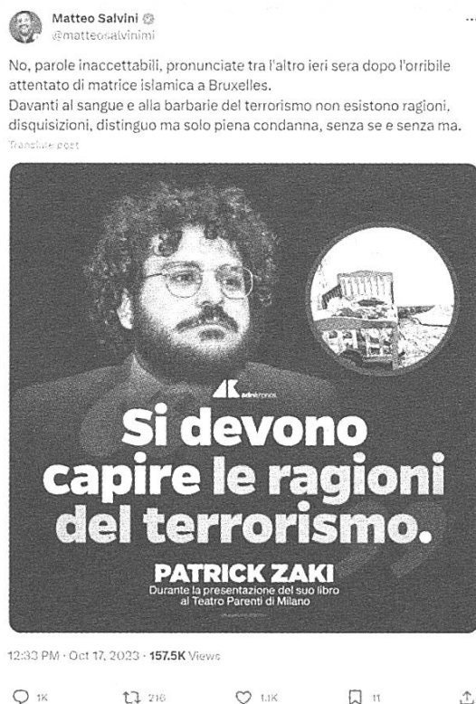
Fig. 9: tweet di @matteosalvinimi del 17/10/2023

brevità dei tweet, multimodalità e polifonia vengono infatti spesso impiegate anche per "veicolare informazioni rapide con effetto di immediatezza, sinteticità e ipersemplicificazione" (Calaresu 2004: 58). Un discorso riportato può quindi essere facilmente manipolato o riprodotto parzialmente per screditarne la fonte, come nel caso seguente: