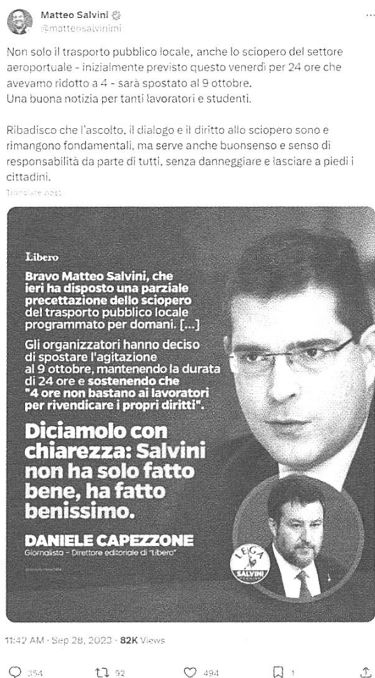
Fig. 8: tweet di @matteosalvinimi del 28/09/2023

In questo caso, il discorso riportato è sfruttato come "strategia retorica, di tipo argomentativo" (Calaresu 2004: 77). L'immagine raffigura sia il locutore del discorso riportato, Daniele Capezzone, sia l'oggetto del discorso, Matteo Salvini; si segnala inoltre che la fonte della notizia è il quotidiano "Libero", citato in chiusura al discorso riportato. Le voci inserite nell'immagine parlante sono due: alla prima, del direttore editoriale del giornale, si aggiunge un secondo discorso riportato attribuito agli organizzatori dello sciopero ("4 ore non bastano ai lavoratori per rivendicare i propri diritti"). In questo caso, il legame tra multimodalità e polifonia viene sfruttato per argomentare in modo più approfondito rispetto allo spazio limitato del tweet e, soprattutto, per avvalorare la posizione politica dello scrivente che, in questo caso, non interviene in veste istituzionale.