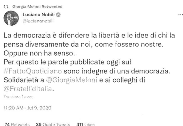
Fig. 3: Retweet di @GiorgiaMeloniIT del 09/07/2020

Nel contesto della comunicazione politica 2.0 il RTw è utilizzato soprattutto in modo autoreferenziale, come nel caso seguente: