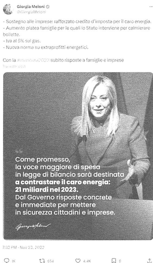
Fig. 6: tweet di @GiorgiaMeloni del 23/11/2022

Per quanto riguarda l'immagine, l'impianto multimodale fittizio della fig. 6 è pressoché sovrapponibile a quello della fig. 5: vi è l'immagine istituzionale del politico, cui si accosta una citazione corredata dalla firma di chi ha pronunciato il discorso. Il testo principale del tweet è però differente: rispetto a quanto visto in Salvini, l'opinione di Meloni viene espressa in fig. 6 tramite "come promesso", elemento di dialogicità secondaria e autocitazionale con cui si fa riferimento alle linee programmatiche previste dalla manovra di cui si discute nel tweet. La posizione di chi scrive resta, infatti, in secondo piano rispetto al tema principale del testo, che si lega all'immagine e al discorso riportato tramite l'hashtag in chiusura (" #manovra2023 "). Nel corpus di Meloni, la posizione istituzionale e il contenuto informativo del messaggio sembrano inoltre dettare la presenza di alcuni elementi che appartengono, sul piano linguistico, all'italiano burocratico-amministrativo (si osservi l'utilizzo dei termini "credito d'imposta" e "calmierare").