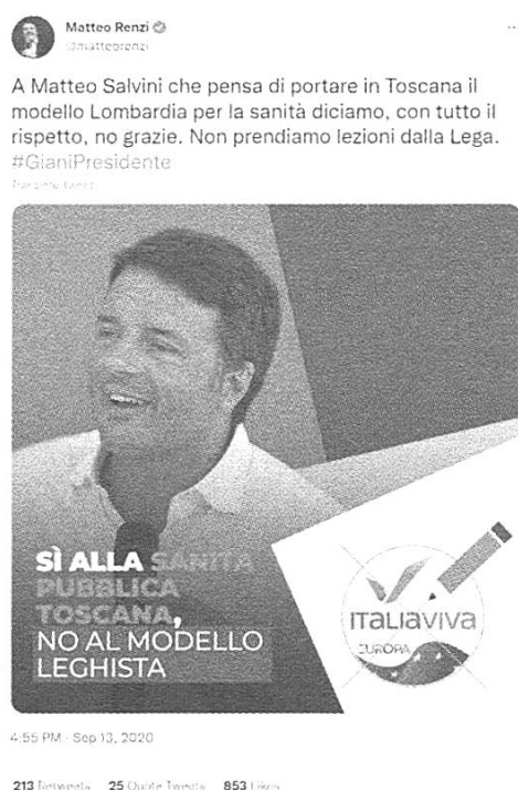
Fig.1: tweet di @matteorenzi del 13/09/2020

Il testo in fig. 1 si pone in una posizione di continuità con altre composizioni multimodali adottate nella comunicazione politica predigitale o tipografica. È infatti chiaro il rimando ai manifesti elettorali tipografici, anche se a differenza dei testi politici tradizionali l'ambiente comunicativo di riferimento è in questo caso più ricco. Nella fig. 1, gli elementi visivi possono interagire sia con il corpo principale del tweet, cui si legano anche tramite l'hashtag ("#GianiPresidente") adottato in chiusura, sia con altre componenti testuali o non verbali contenute nella stessa immagine, quali lo slogan ("Sì alla sanità pubblica toscana, no al modello leghista"; su questo tipo di implicatura presente nei manifesti politici cfr. Lombardi Vallauri 2019: 62) o il simbolo del partito. Lo scopo è di proporre delle composizioni modalmente complesse che siano già presenti nel "sistema di attese" (Prada 2022: 232) di chi fruisce l'oggetto testuale online e che garantiscano, data la forte componente perlocutiva di questo tipo di testo, l'"avvicinamento attanziale" (Orrù 2013: 234) del pubblico, cioè che contribuiscano alla creazione di un legame empatico tra l'emittente e i riceventi.