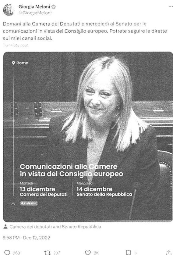
Fig. 4: tweet di @GiorgiaMeloni del 23/10/2022

In questo primo tipo di composizione multimodale, l'immagine rappresenta l'emittente del tweet nel proprio contesto istituzionale di riferimento. L'immagine svolge anche una funzione informativa: le componenti verbali presenti nella foto forniscono ai cittadini le coordinate spazio-temporali (la diretta si svolgerà nei giorni 13 e 14 dicembre presso la Camera dei Deputati e il Senato della Repubblica) dell'evento citato anche nel corpo principale del tweet (le comunicazioni alle Camere in vista del Consiglio Europeo). Questo tipo di testi non prevede la presenza di polifonia; ci sono però alcuni segnali di dialogicità primaria (si notino gli allocutivi e il sistema pronominale, "potrete", "miei"). Il mancato utilizzo della dialogicità secondaria può essere dettato dalla necessità di riportare in un breve spazio tutte le informazioni rilevanti da comunicare al cittadino e può essere, inoltre, motivato dal fatto che il testo in fig. 4 è caratterizzato da un alto grado di personalizzazione e autoreferenzialità, che limita l'inserimento di voci secondarie nel testo.