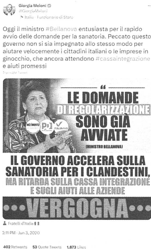
Fig. 10: tweet di @GiorgiaMeloni del 18/06/2020

terrorismo_3rEDkf7Qumg862kARD0JH1 (ultima consultazione del 29 febbraio 2024). Il commento di Zaki si riferisce in realtà agli attacchi di Hamas del 7 ottobre scorso e al modo in cui la stampa ha riportato le notizie relative ai conflitti in Medio Oriente; Zaki non sostiene il terrorismo e suggerisce di analizzare criticamente il contesto (sociale, storico, ecc.) da cui scaturiscono simili forme di violenza.