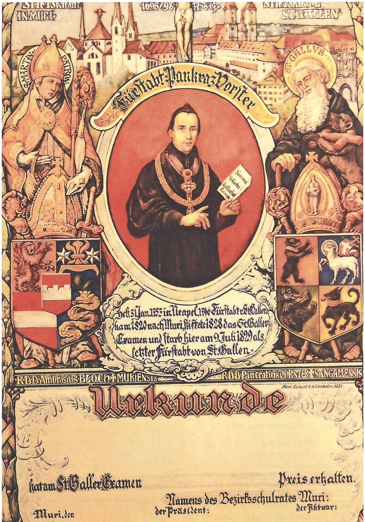
Urkunde für die Preisträger des St. Galler Examens, von Richard A. Nüscheler, 1931.