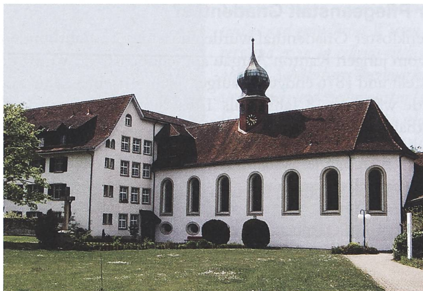
Abbildung 4: Klosterkirche Gnadenthal.

Die erste Klasse sollte für das Gedeihen der Anstalt einen gewissen finanziellen Rückhalt bieten, die 2. Klasse sollte möglichst zur Arbeit auf dem Felde und im Anstaltsbetrieb beigezogen werden. 30 Bald wurde die Pflegeanstalt Gnadenthal zu einer wichtigen Institution für die Altenpflege im Freiamt.