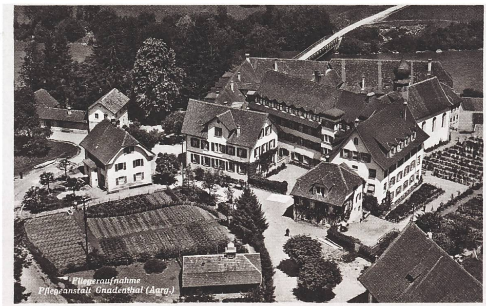
Abbildung 6: Fliegeraufnahme Pflegeanstalt Gnadenthal (Aarg.). Luftbild Alpar, Bern, undatiert.