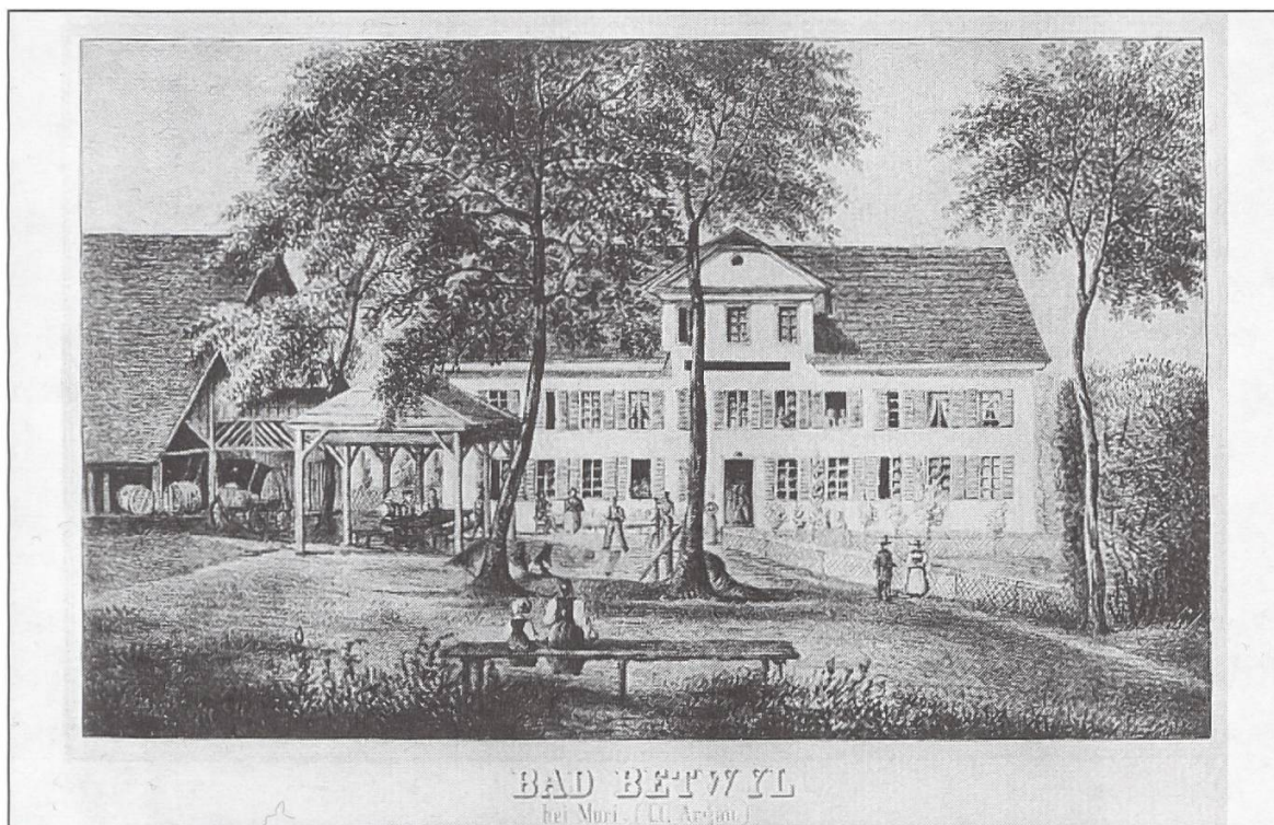
Lithographie in der graphischen Sammlung der ETH Zürich (Nr. 1559 M), wohl von Heinrich Triner und sicher vor dem Brand 1865.