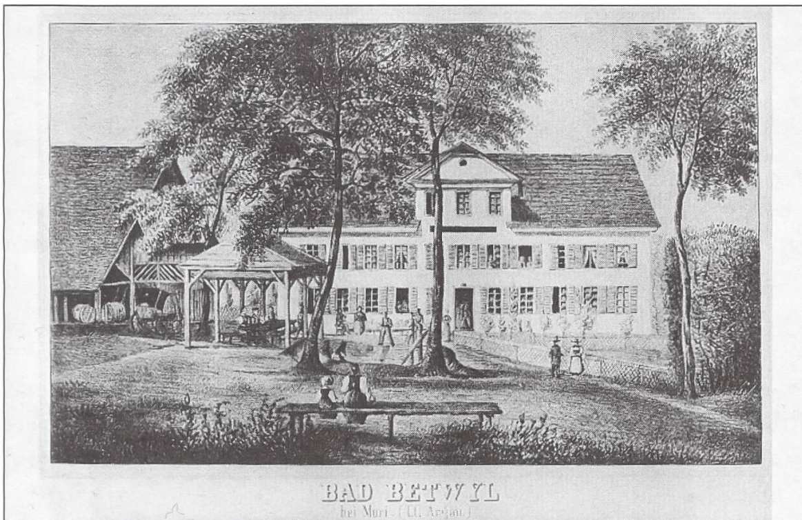
Lithographie in der graphischen Sammlung der ETH Zürich (Nr. 1559 M), wohl von Heinrich Triner und sicher vor dem Brand 1865.