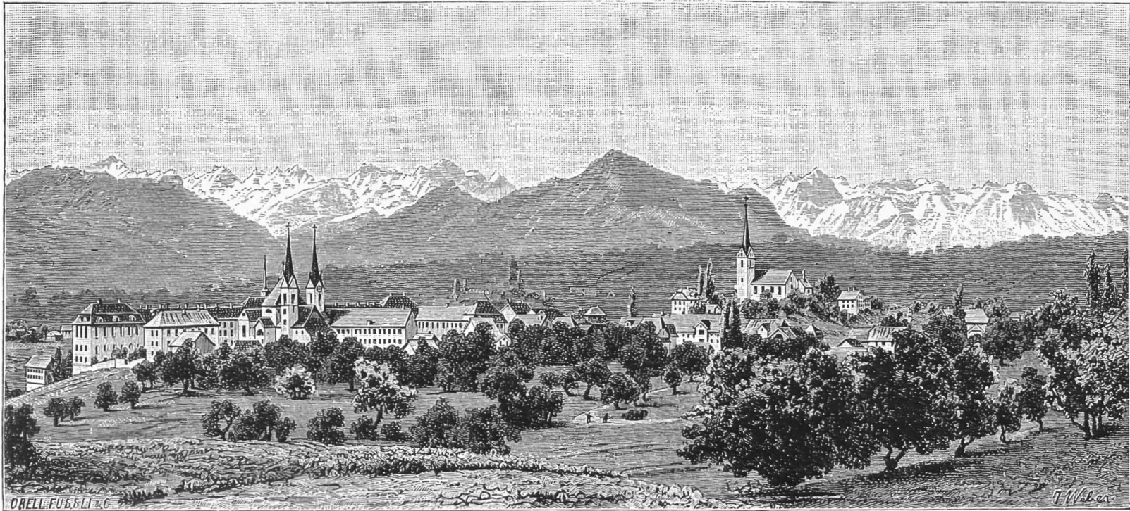
Muri von Norden um 1880