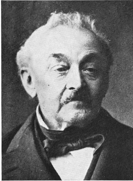
J. J. Glaser 1813—1901