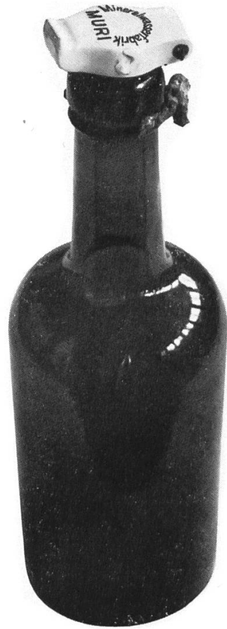
Mineralwasserflasche 3 dl der Mineralwasserfabrik Muri Fundort: Rest. Linde, Muri-Dorf