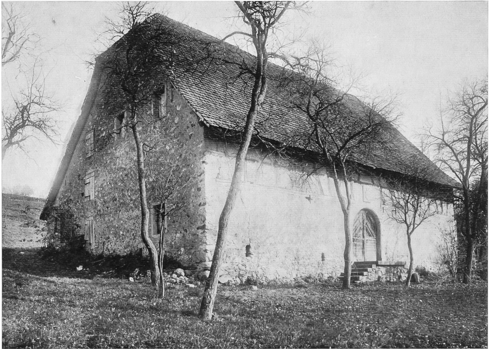
Abb. 1 : Die Weinstrotz des Klosters Muri in Wohlen