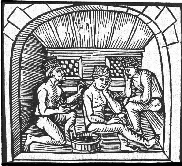
Badstube aus einem Kalender von 1515. Basel, Pamphilus Gengenbach. Darstellung des Schröpfens. Alle drei Personen tragen die aus Stroh verfertigten Badehüte.

rechnen, dass die Produkte der Freiämterstrohflechter damals schon qualitativ und preislich den Strohüten, wie sie in Zürich selbst und auf dem Rafzerfeld hergestellt wurden, überlegen waren. Schon die uns bekannten Aufzeichnungen im