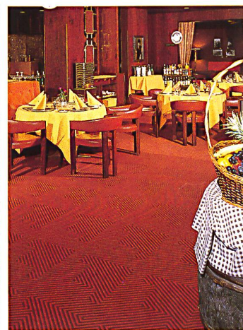
Hotel Hilton, Basel Dessin 577