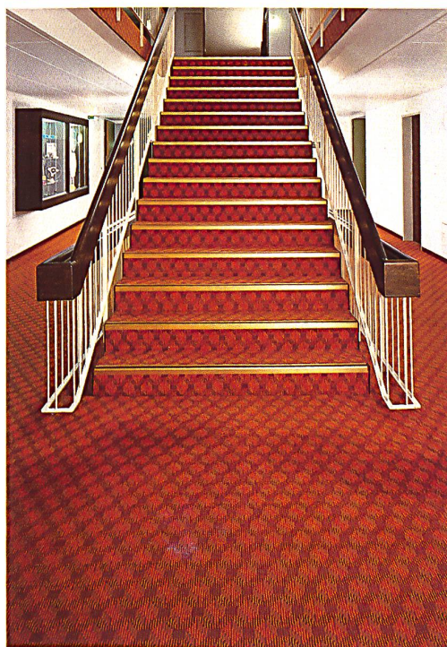
Magic Casino, Degersheim Dessin 785