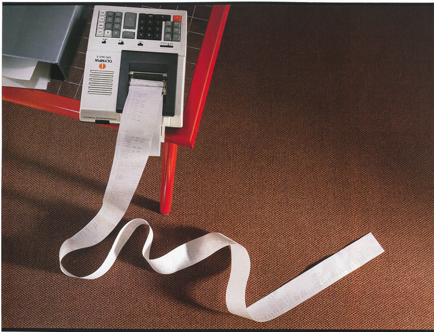
TIARA Domino, getufteter Velours, 100% Polyamid Antron-Plus; Poleinsatzgewicht ca. 760 g/m 2 ; Breite ca. 420 cm; Eignungsbereich: starke Beanspruchung; rollstuhl-, treppen- und bodenheizungsgeeignet. Rücken: textiler Zweitrücken TIARA-Textbac.