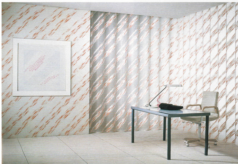
△ Aus der Gruppe Grafik: Dessin «Dreieck» Leuchtende Farben betonen modernes, geometrisches Design.