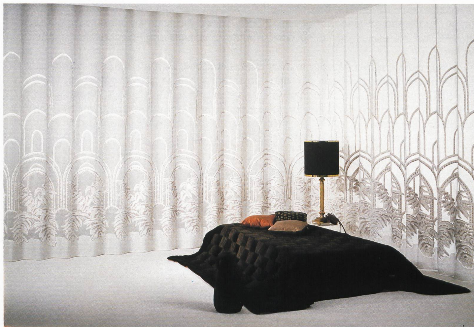
△ Aus der Gruppe Fantasie: Dessin «Feuerwerk» Natürliche Gegebenheiten in jugendlich modernem Dessin.