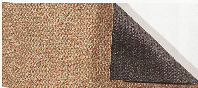
Centostar-Tweed Balsa mit Kohlenstoffrücken