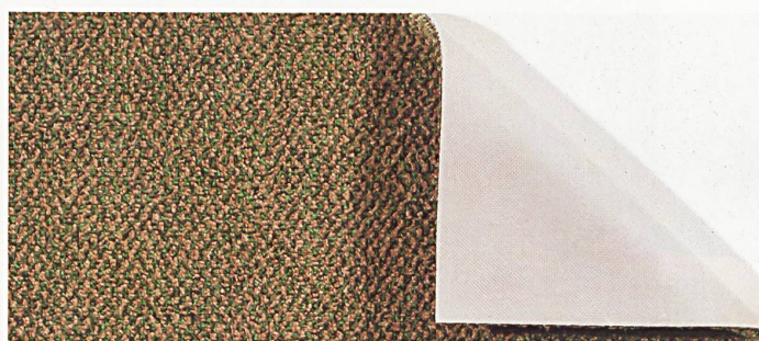
Centostar-Tweed Iroko mit Kompaktschaumrücken