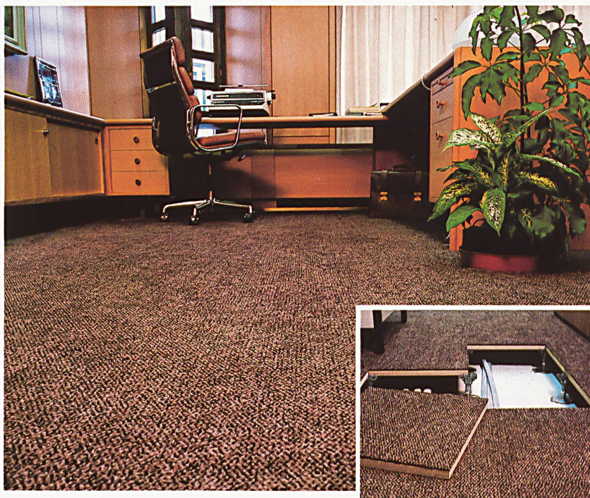
Stamflor-Centostar in der Kantonalbank Winterthur (Doppelboden)