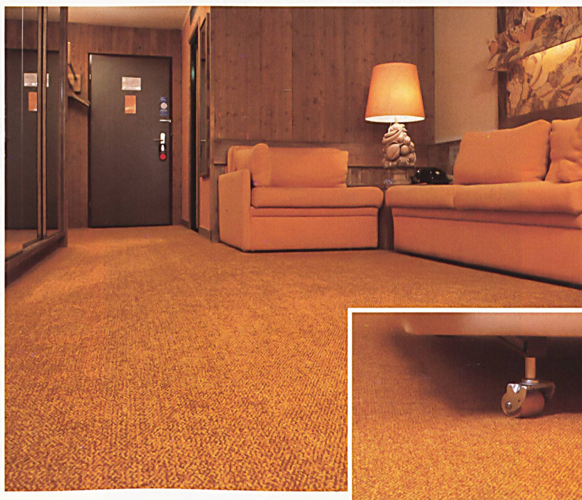
Stamflor-Centostar im Hotel Mövenpick, Opfikon (Spezialfarbe)