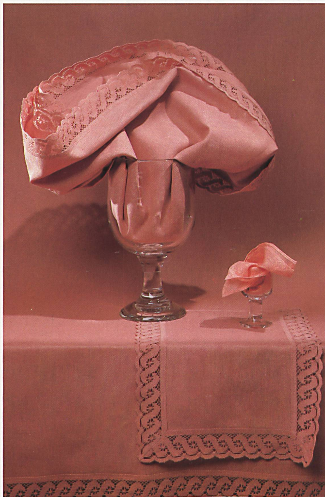
Halbleinengewebe mit Ton in Ton eingefärbter Klöppelspitze, konfektioniert als Tischtuch – rund und eckig – und als Table mat mit «Switzerland»-Servietten kombinierbar, in den Koloriten Crème, Beige, Rose und Sauge.