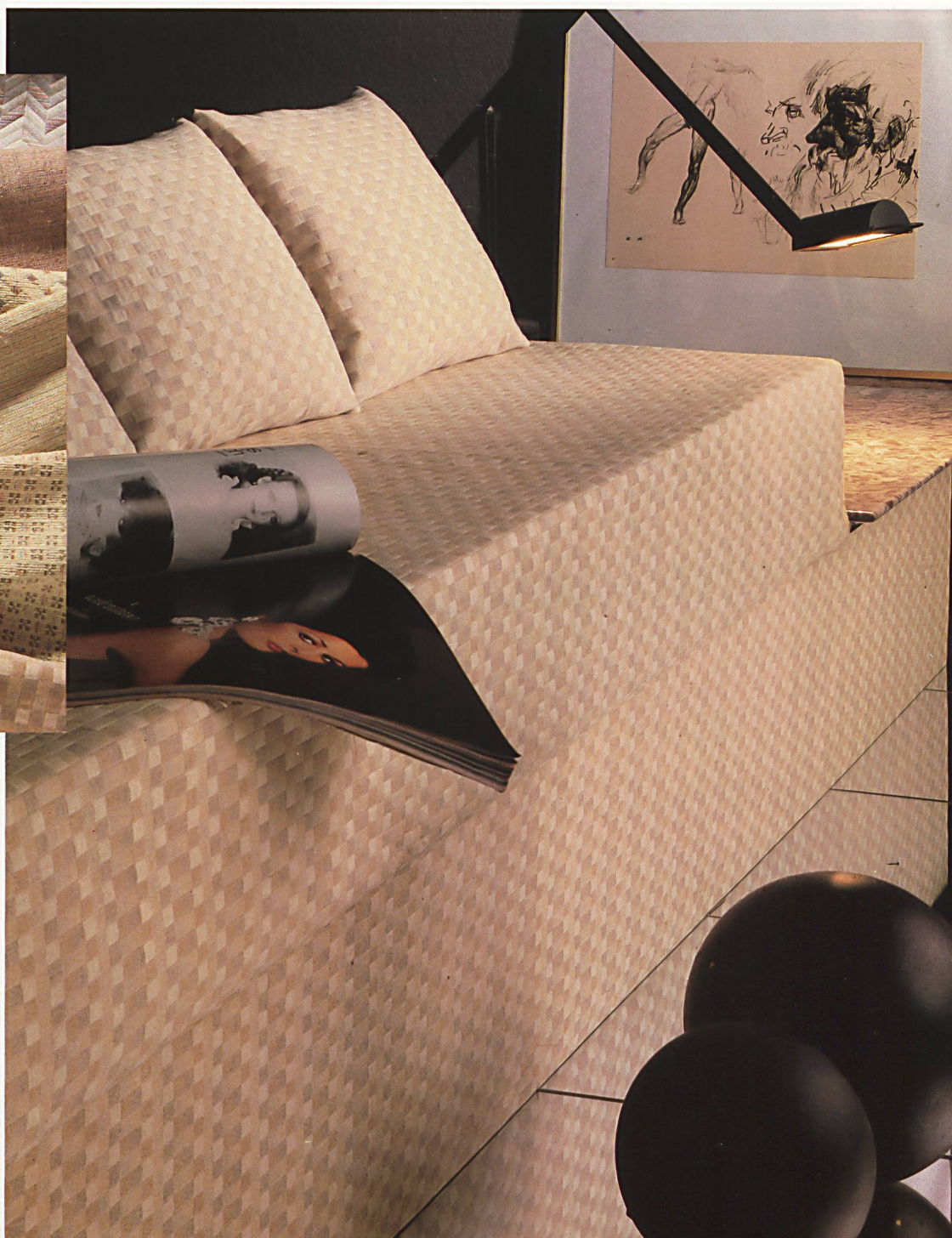
70 • lana/acryle.