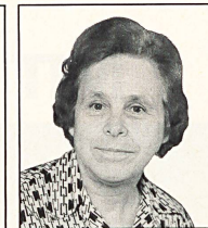
LORE WOLF Abt. Bettwäsche der Firma C.F. Braun, D-Stuttgart

Was die Dessins-Vorliebe anbelangt, werden nach meiner Beobachtung von den Kundinnen vorwiegend «Versailles», dann «Masumbai» und «Clifton» gewählt.»