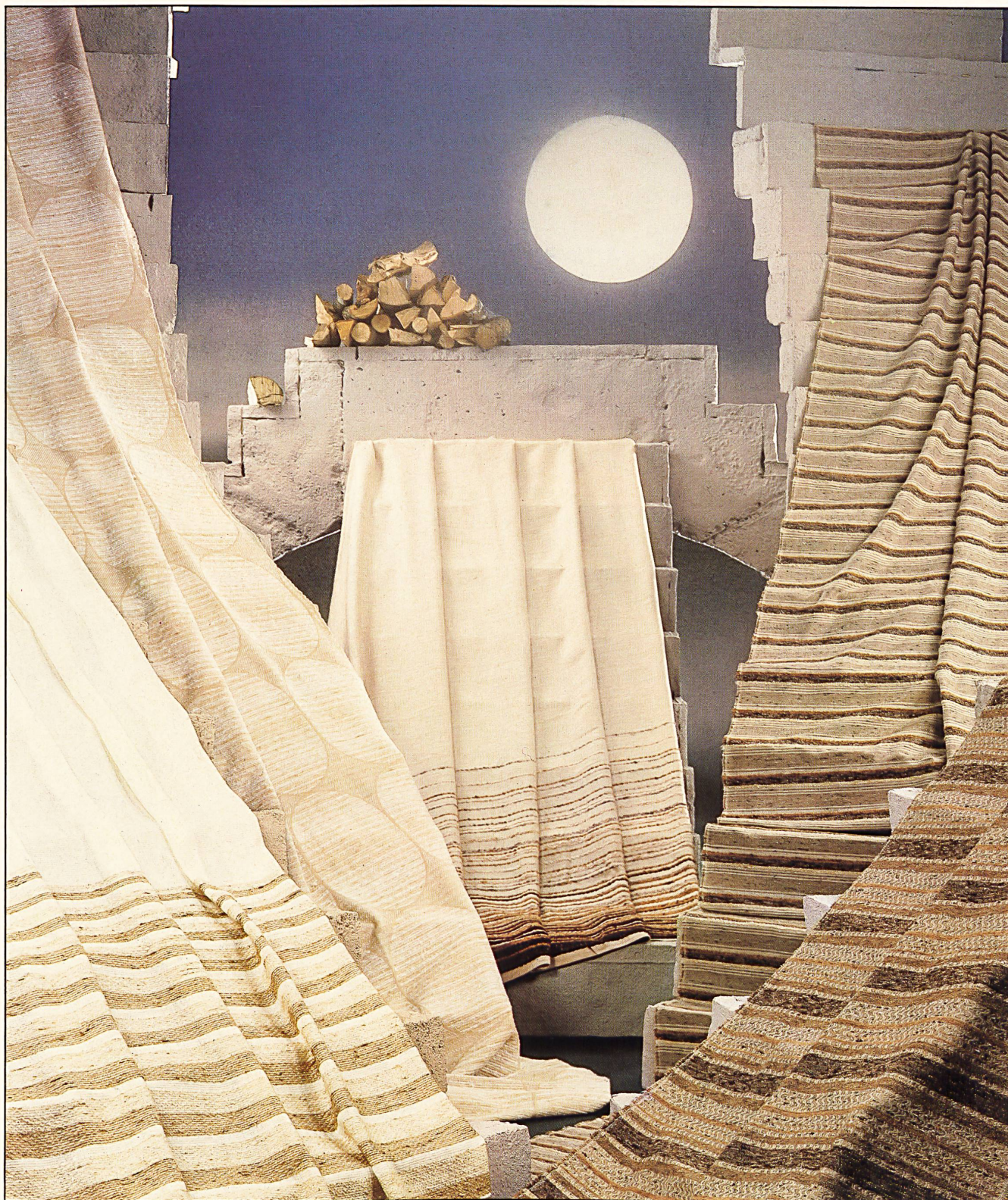
De gauche à droite: Large panneau à effet soyeux, 260 cm de haut / Breitpanel mit Seideneffekt, 260 cm Höhe / Wide panel with silk effect, 260 cm high / Panel largo con effetto serico, altezza 260 cm. (Burgauer + Co. AG, St. Gallen) Von links nach rechts: Tissue jacquard pour la décoration en Acrilan® / Jacquard-Dekogewebe aus Acrilan® / Jacquard furnishing fabric in Acrilan® / Tessuto jacquard per arredamento, di Acrilan®. (Burgauer + Co. AG, St. Gallen) From left to right: «Alassio», tissu pour la décoration avec rayures en filés pour effets / Dekostoff mit Effektgarnstreifen / Furnishing fabric with effect yarn stripes / Tessuto per arredamento con righe di filati d'effetto. (J. Pelz + Cie SA, Cartigny) Da sinistra a destra: Tissue rayé avec effets de fils volumineux / Streifengewebe mit Bauschgarn-effekten / Striped fabric with bulky yarn effects / Tessuto a righe, con effetto a batuffolo. (Schläpfer + Co., Teufen) Tissue pour la décoration avec effets de filés et d'armure en Acrilan® / Dekostoff mit Garn- und Webeffekten aus Acrilan® / Furnishing fabric with yarn and weave effects in Acrilan® / Tessuto per arredamento con effetti di filato e di tessitura, di Acrilan®. (Schläpfer + Co., Teufen)