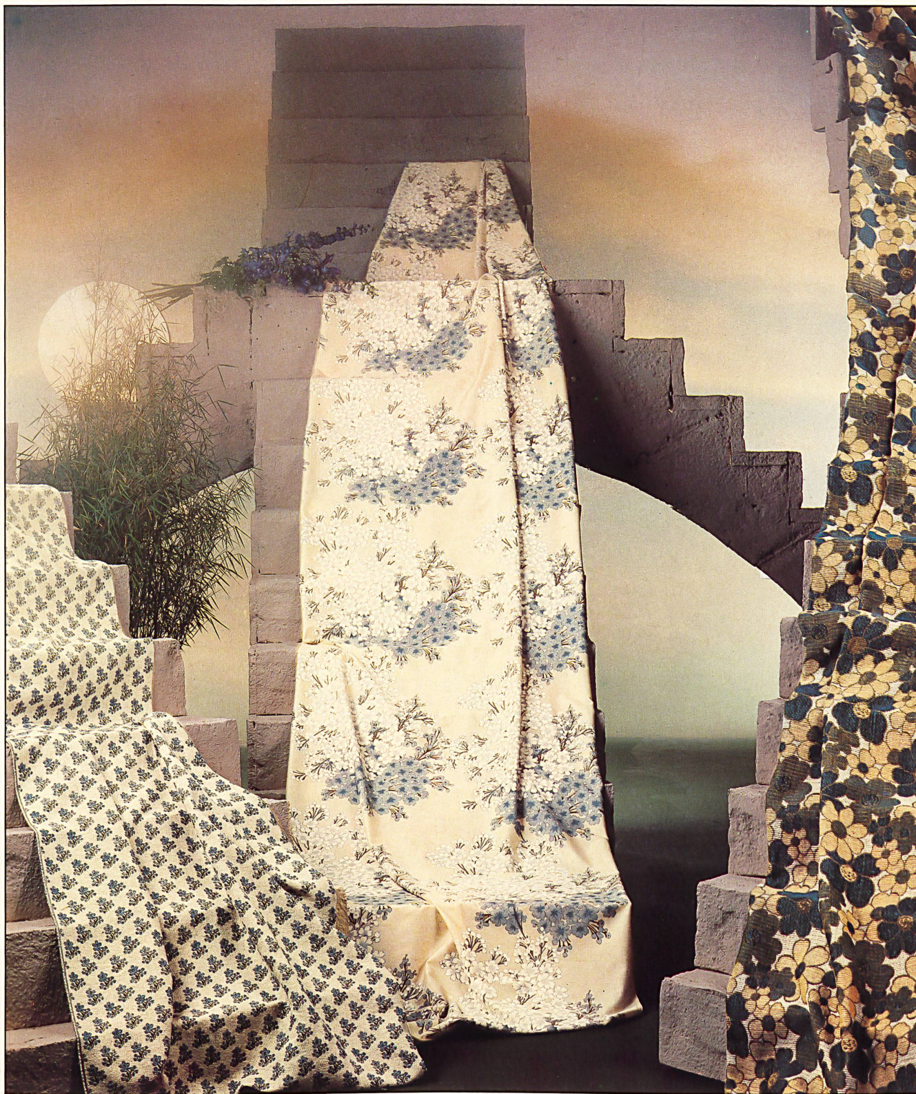
De gauche à droite: Tissu jacquard pour la décoration, en diverses combinaisons de coloris / Jacquard-Dekostoff in diversen Farbstellungen / Jacquard Von links nach rechts: furnishing fabric in various combinations of colours / Tessuto jacquard per arredamento, in varie tinte. (Habib Textil AG, Flawil) From left to right: «Viola», tissu ratière en polyester et soie (82:18) / Schaftgewebe, 82% Polyester, 18% Seide / Dobby-loom fabric, 82% polyester, Da sinistra a destra: 18% silk / Tessuto a liccio, poliestere 82%, seta 18%. (J.G. Nef-Nelo AG, Herisau). «Diessenhofen», tissu jacquard pour la décoration / Jacquard-Dekostoff / Jacquard furnishing fabric / Tessuto jacquard per arredamento. (J. Pelz + Cie SA, Cartigny)