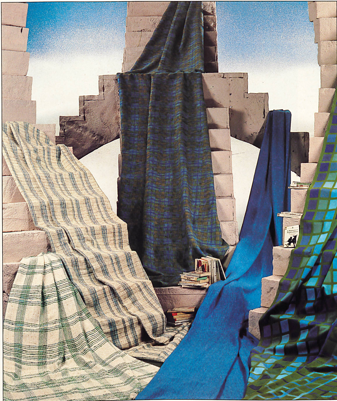
De gauche à droite: Tissus pour la décoration, tissés en couleurs avec filés pour effets / Dekobuntgewebe mit Effektgarnen / Colour-woven furnishing fabrics with effect yarns / Tessuti multicolori per arredamento, con filati d'effetto. ( Habis Textil AG, Flawil ) Von links nach rechts: Tissu pour la décoration, chaîne et trame en coton et lin / Dekostoff, Kette und Schuss: Baumwolle/Leinen / Furnishing fabric, warp and weft: cotton/linen / Tessuto per arredamento, catena e trama di cotone e lino. ( Textilwerk Tesserete, Tesserete ) Da sinistra a destra: «El Paso», tissu structuré pour la décoration en acryl, lin et coton (70:15:15), 160 cm / Dekogewebe strukturiert, 70% Acryl, 15% Leinen, 15% Baumwolle, 160 cm / Structured furnishing fabric, 70% acryl, 15% linen, 15% cotton, 160 cm. / Tessuto strutturato per arredamento, acrilico 70%, lino 15%, cotone 15%, 160 cm. ( Baumann Weberei + Färberei AG, Langenthal ) «Maiolica», tissu double, pur coton, teint en fil, 160 cm / Doppelgewebe, garnegefärbt, 100% Baumwolle, 160 cm / Double-weave yarn-dyed, pure cotton fabric, 160 cm / Tessuto doppio, tinto in filo, puro cotone, 160 cm. ( Baumann Weberei + Färberei AG, Langenthal )