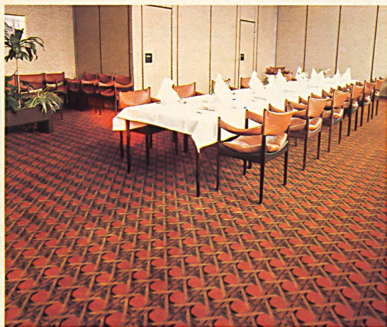
Exklusive Webteppiche nach Mass

Im grosszügig gebauten Diana-Zentrum des Raiffeisenhauses in Wien liegen Melchnauer Teppiche aus reiner Schurwolle (Wollsiegel-Qualität), teils dem modernen, äusserst reichhaltigen « Wilton »-Sortiment entnommen, teils jedoch ganz nach speziellen Dessin- und Farbwünschen des Architekten Schalleck auf genaues Mass gewoben.