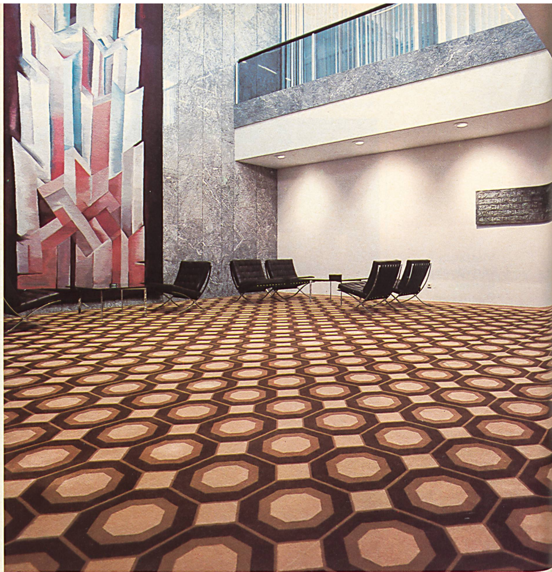
"Golden Wilton", 0499/503, pure new wool (Woolmark quality)