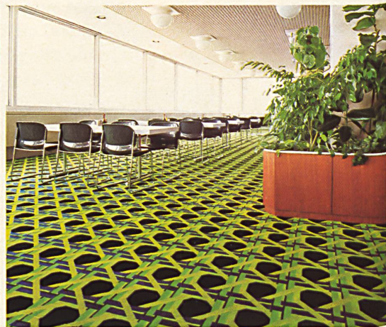
Tappeti tessuti esclusivi su misura

Nel grandioso Centro Diana della Casa Raiffeisen di Vienna si trovano tappeti di Melchnau di pura lana vergine (la qualità marchio lana), in parte provenienti dal moderno e copiosissimo assortimento « Wilton », in parte però tessuti esattamente su misura secondo speciali desideri dell'architetto Schalleck per quanto riguarda il disegno e il colore.